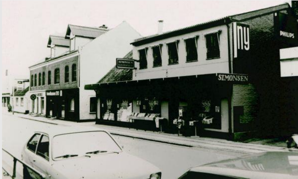
Nørregade 29 og 31 på ældre fotografi.